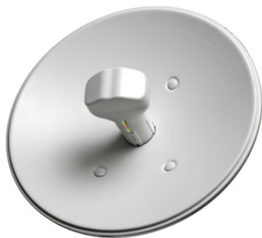
Antenne NanoBridge M5

Par la suite, seul un problème physique pourra nécessiter un accès au point d'installation de l'antenne (par exemple en cas de dommages ou déplacement).