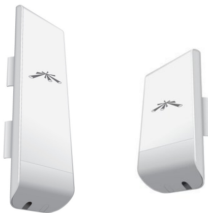
Antenne NanoStation M5 & NanoStation Loco M5